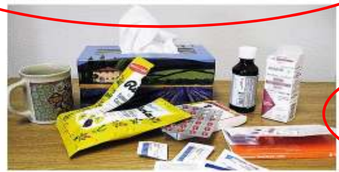
2011. g. 27. februāris, 08:10 Parakstot pacientiem konkrētus medikamentus, ārsti no zāļu ražotājfirmas KRKA, pretim ir saņēmuši ļoti bagātīgas dāvanas, šovakar vēsta raidījums "Nekā personīga".